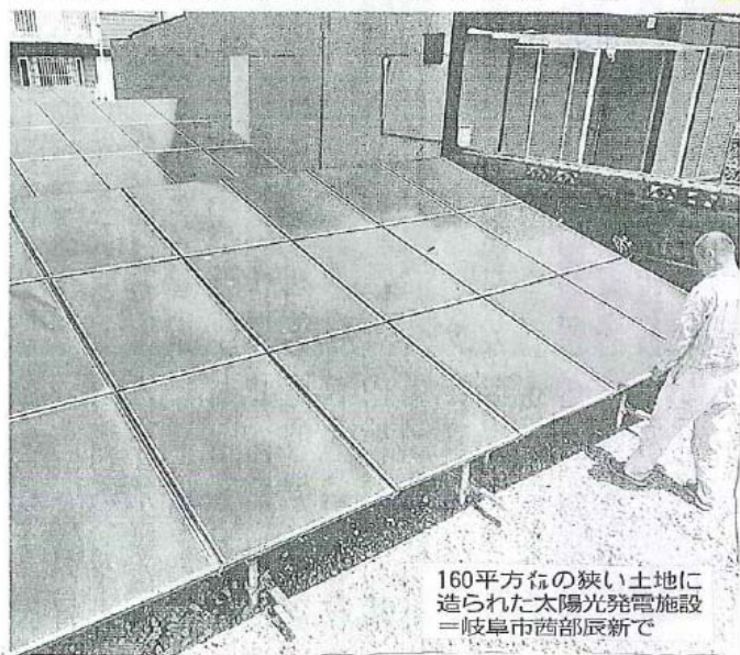
160平方メートルの狭い土地に造られた太陽光発電施設＝岐阜市西部辰新で